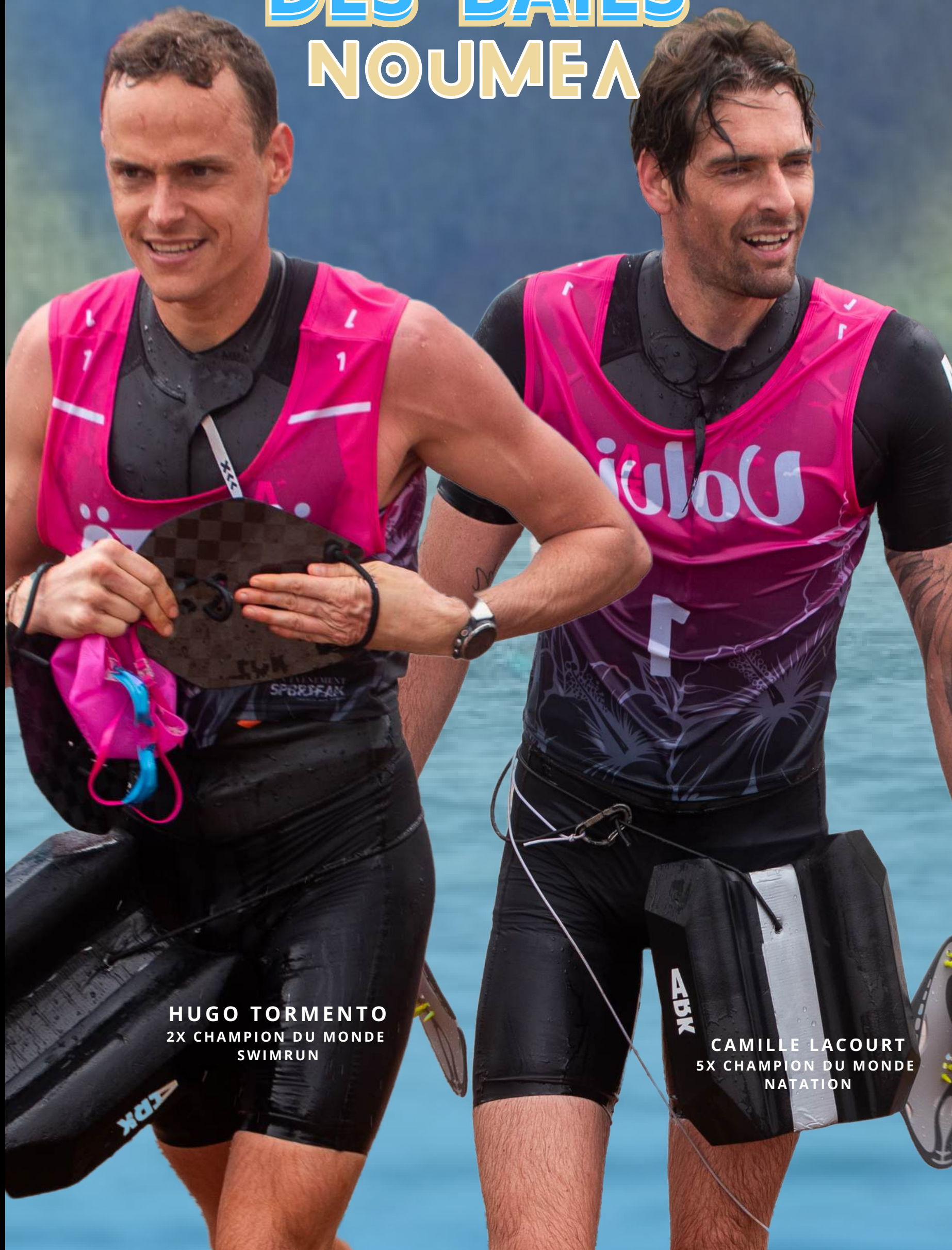
HUGO TORMENTO 2X CHAMPION DU MONDE SWIMRUN